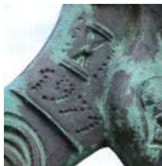
1971 met koker