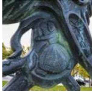
Uier met boerin