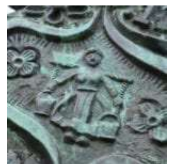
Boerin met juk en bloemen

Het jaartal 1971 heeft te maken met een ingemetselde loden koker, met daarin elf formulieren en vragen. Want hoe zou de stad er uitzien over elf jaar? Wat de concrete antwoorden op die vragen waren, is niet bekend.