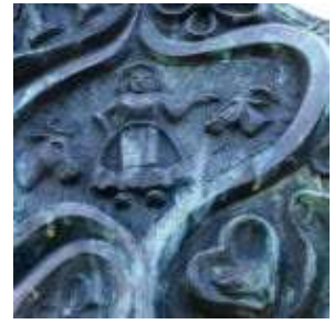
Boerin met os en ram