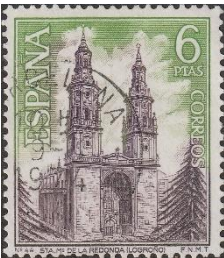
Santa Maria de la Redonda

Net voor Logroño rijden we de autonome regio La Rioja binnen. In Logroño staat op de Plaza de barokke en toch sobere kathedraal Santa Maria de la Redonda. Via Navarrete en Huércanos rijden we naar het oude koningsstadje Nájera met de kloosterkerk Santa Maria la Real met romaans / gotische kruisgang.