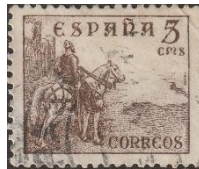
Ruiterstandbeeld El Cid