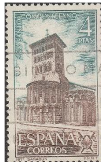
San Tirso kerk in Mudajar-stijl