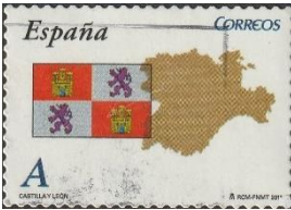
Autonome regio Castilië Y León

Voor een overnachting rijden we door naar Redicillia del Camino in de provincie Burgos in de autonome regio Castilla y León.