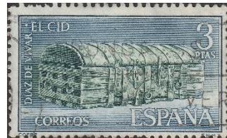
Schatkist El Cid in kathedraal Burgos

Van hem staat ook een ruiterstandbeeld aan het begin van de Paseo del Espolón (langs de Rio Arlanzón).