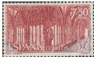
Kruisgang in klooster Santa Maria in Nájera

We rijden door naar St. Domingo de la Calzada met een Romaanse kathedraal met barokke, 18 de eeuwse, klokkentoren gebouwd in 1158.