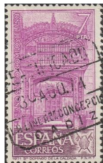
Portaal kathedraal Santa Domingo de la Calzada

We rijden door naar St. Domingo de la Calzada met een Romaanse kathedraal met barokke, 18 de eeuwse, klokkentoren gebouwd in 1158.