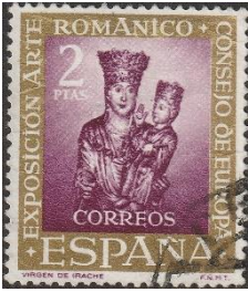
Madonna uit de Romaanse kerk van Irache 12 de eeuw

oudste klooster Santa Maria la Real de Irache. Bij dit klooster is een tappunt voor water, maar ook voor gratis lekkere rode wijn. Pas op: niet te veel van drinken, want dan kun je niet meer fietsen. Na een paar flinke klimmen komen er enkele afdalingen; hoogste snelheid is 51,2 km/uur.