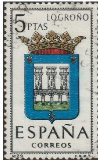
Provinciewapen en klederdracht van de provincie Logroño