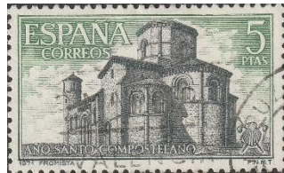
San Martin in Fromista

Bij Castrillo de Cabezón rijden we over een middeleeuwse brug met elf bogen en komen aan in de provincie Palencia. In het kleine dorp Frómista staan wel drie kerken; San Martin, San Pedro met gotisch 16 de eeuwse beeld van St. Jacob en Santa Maria del Castillo.