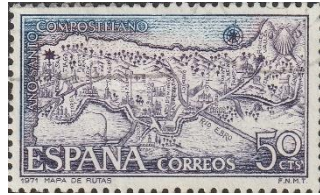
St. Jacobsroute door Noord Spanje

Hier volgt een beklimming van 30 kilometer lang naar een hoogte van 1057 meter. We klimmen flink tot Valcarlos, het Karelsdal, Dit is het dal waar Karel de Grote met zijn leger uitrustte op zijn terugtocht na alle Spaanse veldslagen tegen de Moren. Hij hoorde de trompet van zijn ridder Roeland, de aanvoerder van de achterhoede, toen deze verslagen werd door de Basken bij de pas van Roncesvalles (15 augustus 778). In de kerk staat een beeld van St. Jacob de Morendoder. Op de top van de Alto Ibañeta staat een monument ter nagedachtenis aan Ro(e)land, die hier gesneuveld zou zijn, met ernaast een kleine kapel