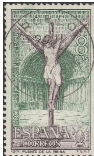
Kruis voor de Romaanse kerk El Crucifijo

Na een overnachting alhier rijden we door naar Estella, of Lizarra in het Baskisch. Hier lopen veel mensen in traditionele feestkledij; witte kledij met rode sjerpen en alpinomutsen. Dit zijn de Carlisten; dit is een politieke beweging ontstaan uit een twist over de Spaanse troonopvolging. Naast de ingang van de kerk Santa Sepulcro, uit 1328, staat een beeld van St. Jacob als pelgrim. Na Ayegui rijden we langs het