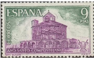
Romaanse kapel Ermita de Eunate

We rijden verder ook langs Ermita de Eunate en Obanos naar Puente de la Reina.