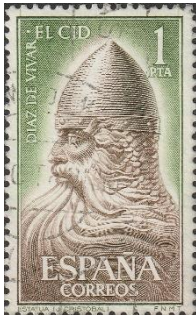
Rodrigo Diaz de Vivar; El Cid