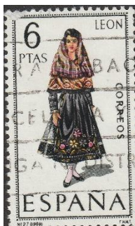
Provinciewapen en klederdracht León