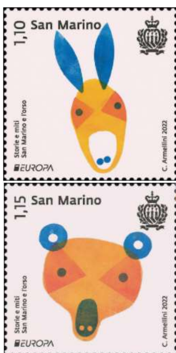
Europa CEPT zegels 2022

OOOOOCOOOOOCOOOOOCOOOOOCOOOOOCOOOOOCOOOOOCOOOOOCOOOOOCOO