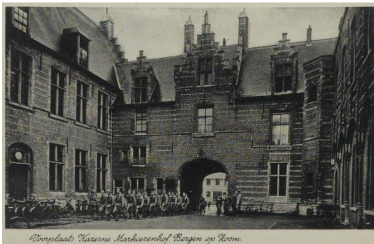
Voortplaats Kazerne Markiezenhof, Bergen op Zoom.

De gemeente had het Markiezenhof complex in eigendom gekregen maar vanaf 1818 tot 1957 deed het dienst als kazerne. Het Markiezenhof; ofwel kazerne Prinsenhof, bood plaats aan een peloton soldaten van het 3e Regiment Infanterie Tijdens die militaire bestemming,